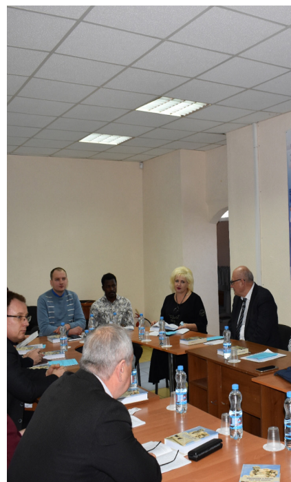
Управление международной деятельности КФУ им. В.И. Вернадского

Осуществленная во время круглого стола запись воспоминаний и размышлений участников референдума 20 января 1991 года станет важным материалом для изучения новейшей истории Крыма.