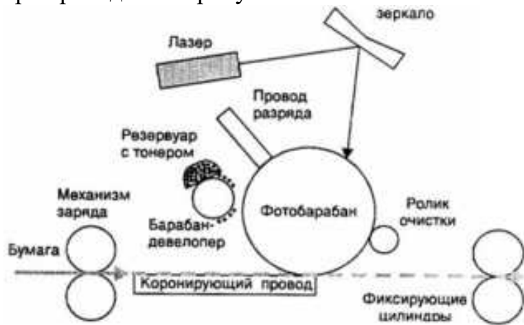
Рисунок 3 - Функциональная схема лазерного принтера* *Источник: [1]

текста, в котором они упоминаются впервые. Например, Функциональная схема лазерного принтера приведена на рисунке 3.