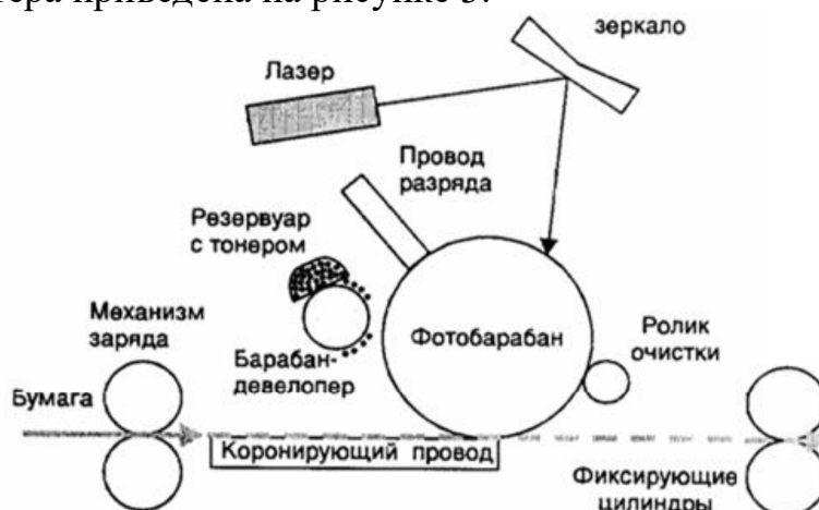
Рисунок 3 - Функциональная схема лазерного принтера*

текста, в котором они упоминаются впервые. Например, Функциональная схема лазерного принтера приведена на рисунке 3.