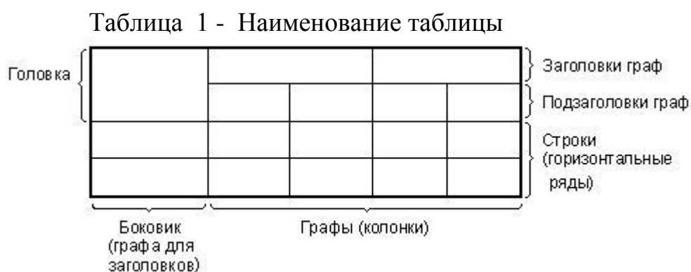
Рисунок 4 - Оформление таблицы

Таблицу с большим числом строк допускается переносить на другой лист (страницу). При переносе части таблицы на другой лист (страницу) слово «Таблица», ее номер и наименование указывают один раз слева над первой частью таблицы, а над другими частями также слева пишут слова «Продолжение таблицы» и указывают номер таблицы. Пример оформления переноса таблицы приведен на рисунке 5.