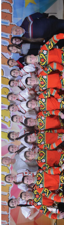
Народный ансамбль танца "Юность" Дома культуры Медицинской академии имени С.М. Георгиевского стал лауреатом I этапа Международного многожанрового онлайн-конкурса «Российский Берег – Победной Мать», приуроченного к 75-й годовщине Победы в Великой Отечественной войне.

— Мы отправили на конкурс видеозапись нашего танца, его высоко оценило республиканское жюри. Несмотря на все трудности, которые сейчас возникли, мы сумели организовать онлайн-репетиции два раза в неделю, — рассказал преподаватель кафедры ортопедической стоматологии, заслуженный деятель искусств АР Крым, заслуженный работник культуры Украины, лауреат государственной пре-