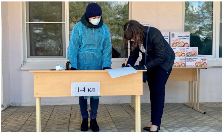
В мае выдача сухих пайков продолжится.

В обычное время ученикам 1-4 классов из семей, имеющих право на социальные льготы, предоставлялся дополнительно ещё и обед. Дети, растущие без родителей, инвалиды, школьни-