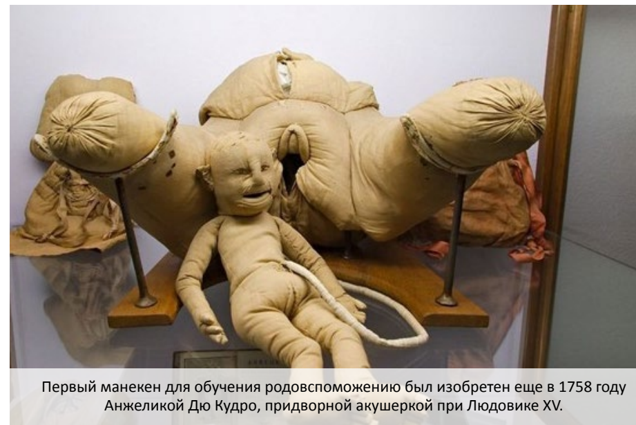
Первый манекен для обучения родовспоможению был изобретен еще в 1758 году Анжеликой Дю Кудро, придворной акушеркой при Людовике XV.

Медицинская академия КФУ — одно из немногих учебных заведений России и единственное в Крыму, где есть современный высокотехнологичный симуляционный центр для подготовки и аккредитации медицинских специалистов разного профиля.