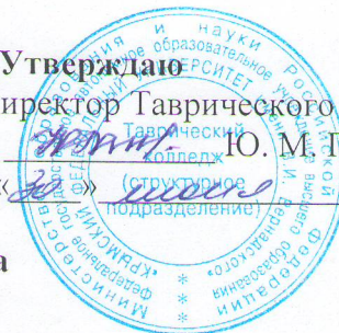
График учебного процесса на 2017-2018 учебный год специальности 38.02.06 Финансы