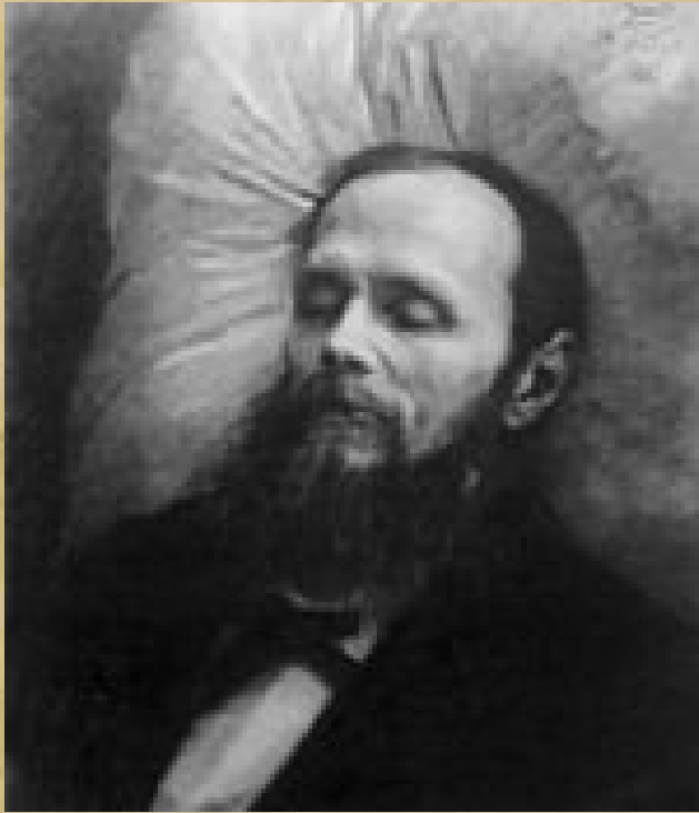
Посмертный портрет И. Н. Крамского «Ф. М. Достоевский на смертном одре»

1 февраля 1881 года Ф. М. Достоевский был похоронен на Тихвинском кладбище Александро-Невской лавры в Санкт-Петербурге