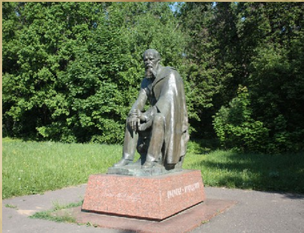
Музей "Усадьба Ф.М. Достоевского в с. Даровое