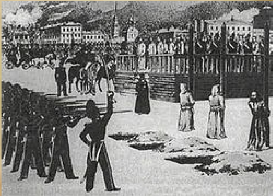
Инсценирование казни на Семёновском плацу

19 ноября смертный приговор Достоевскому был отменён по заключению генерал-аудиториата «ввиду несоответствия его вине осужденного» с осуждением к восьмилетнему сроку каторги. В конце ноября император Николай I при утверждении подготовленного генерал-аудиториатом приговора петрашевцам заменил восьмилетний срок каторги Достоевскому четырёхлетним с последующей военной службой рядовым.