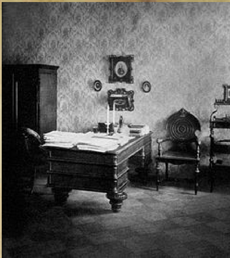
Рабочий кабинет писателя на последней квартире в Петербурге