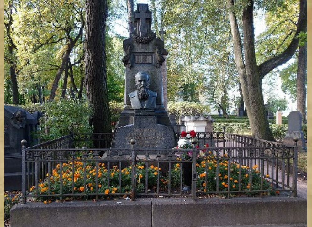
Памятник на могиле Ф. М. Достоевского