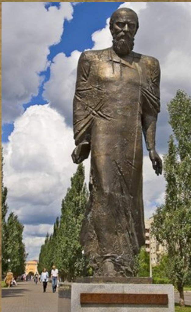
Памятник в Омске