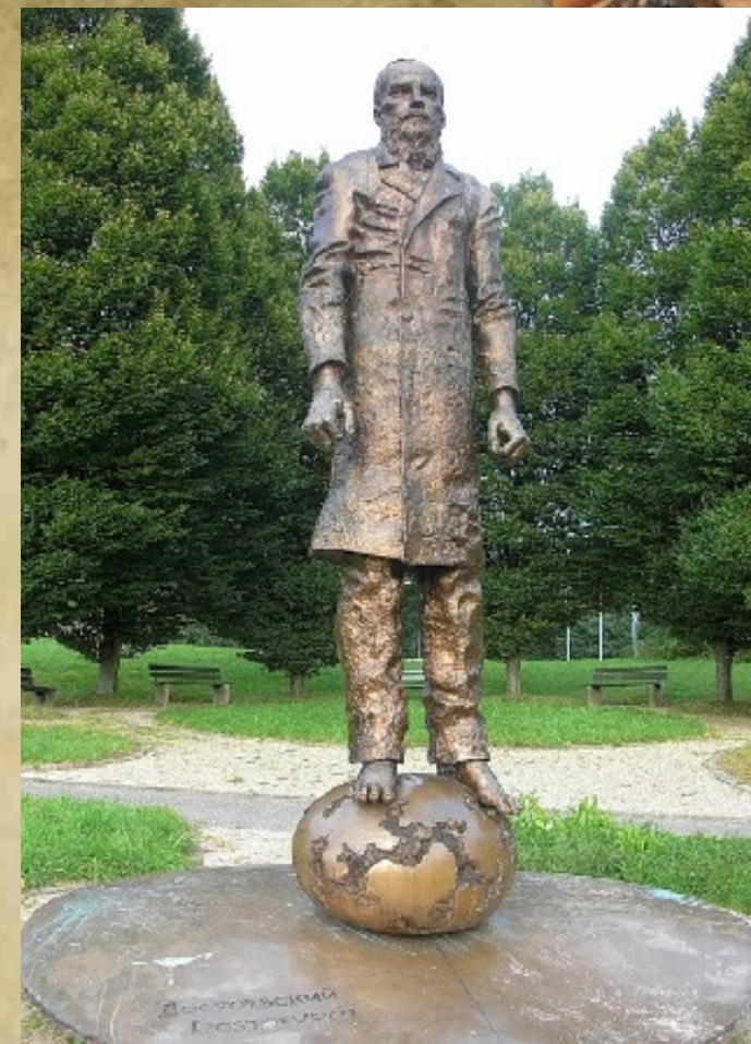
Памятник в Баден-Бадене