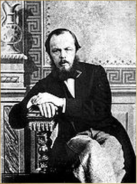
Достоевский в 1863 году

30 июня 1859 года Достоевскому выдали временный билет, разрешающий ему выезд в Тверь, и 2 июля писатель покинул Семипалатинск. В конце декабря 1859 года Достоевский с женой и приёмным сыном Павлом вернулся в Петербург, но негласное наблюдение за писателем не прекращалось до середины 1870-х годов. Достоевский был освобождён от надзора полиции 9 июля 1875 года.