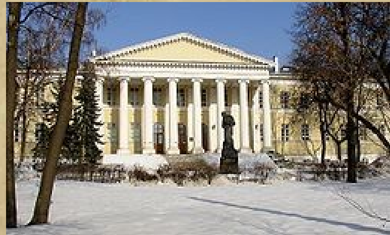
Мариинская больница для бедных с перенесённым в 1936 году памятником писателю, созданным С. Д. Меркуровым