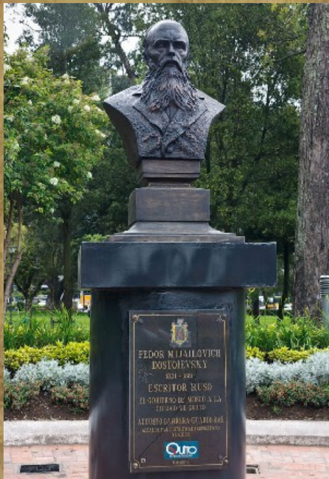
Памятник в Кито (Эквадор)