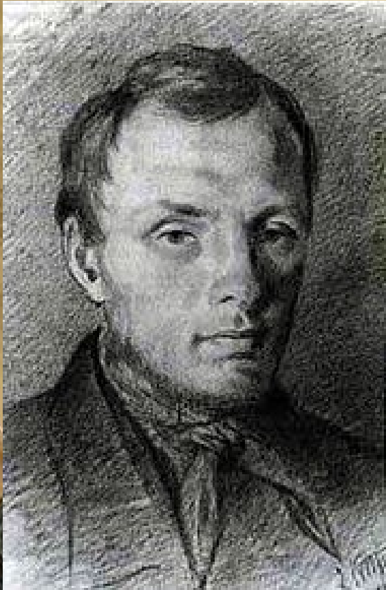
Достоевский в 26 лет, рисунок К. Трутовского, итальянский карандаш, бумага, (1847), (ГЛМ)

Эти первые юношеские произведения не сохранились. В конце 1843 и начале 1844 года Достоевский переводил роман Эжена Сю «Матильда», и, немного позднее, роман Жорж Санд «Последняя из Альдини», одновременно начав работу над собственным романом «Бедные люди». Оба перевода не были завершены. В то же время Достоевский писал рассказы, которые не были закончены.