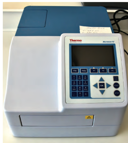
Анализатор иммунологический Multiskan FC, Thermo Fisher Scientific.