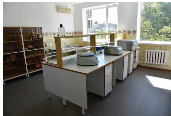
Общий вид помещений лаборатории молекулярной биологии