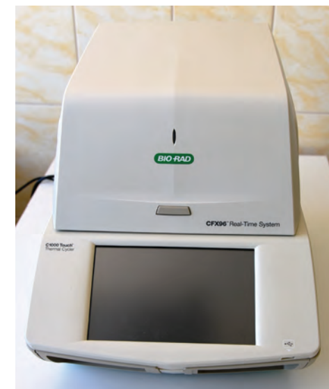
Термоциклер CFX96 Touch Real Time + в комплекте с русифици- рованным программным обеспе- чением, Bio-Rad Laboratories