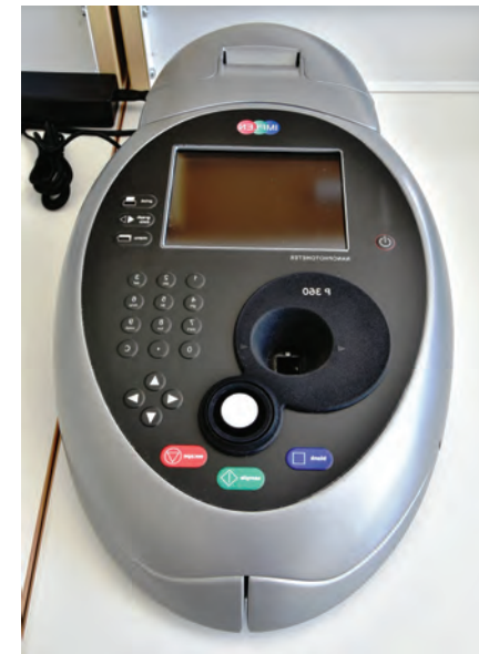
Спектрофотометр UV/VIS NanoPhotometer™ P 360, Implen GmbH.