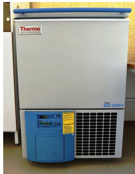
Морозильник Forma 803CV, Thermo Fisher Scientific