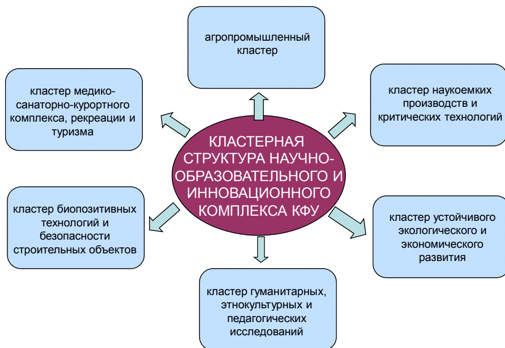
Рис. 1. Приоритетные направления развития Университета, реализуемые по типу многоотраслевых научно-образовательных кластеров инновационного типа.

В рамках многоотраслевых научно-образовательных кластеров инновационного типа будут созданы центры превосходства (центры коллективного пользования, научно-образовательные центры и пр.), обеспечивающие высокий уровень исследований и реализации образовательных программ.